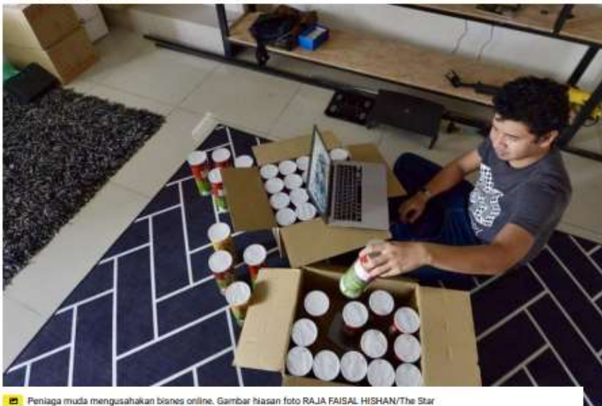
Peniaga muda mengusahakan bisnes online. Gambar hiasan