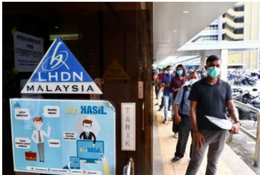
Keuntungan perniagaan dikongsi melalui cukai yang dibayar kepada Lembaga Hasil Dalam Negeri Malaysia (HASIL).