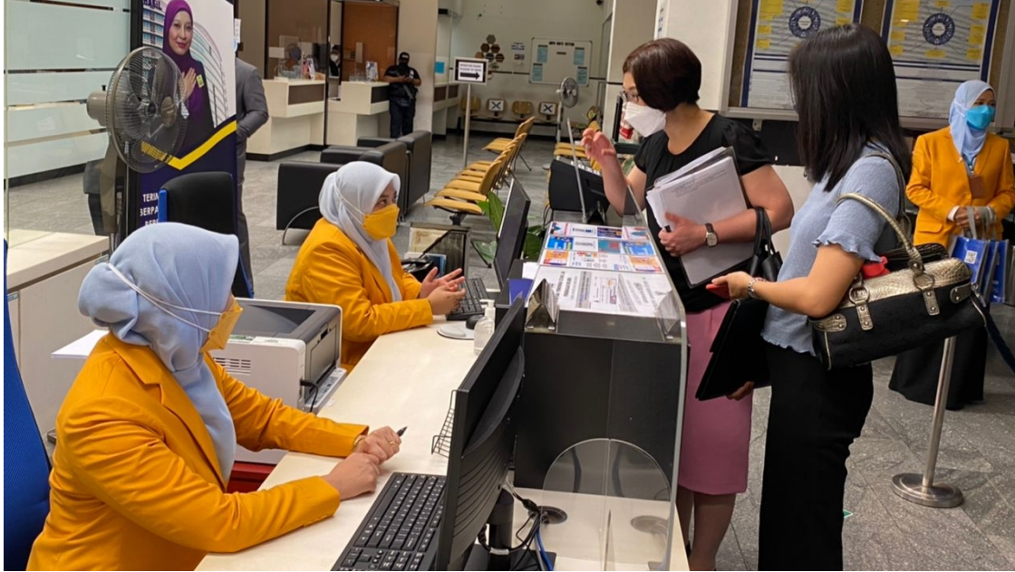
Pembayar cukai yang sedang berurusan di kaunter LHDN

By Editor ( https://www.malakattribunenews.com/author/editor-malakat-tribune/ ) - Apr 29, 2022