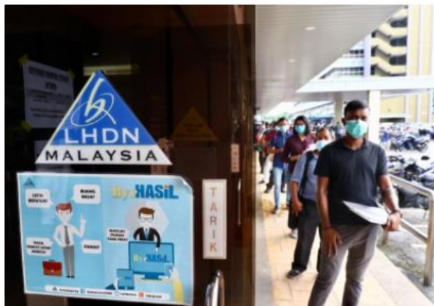
Ekonomi gig seharusnya dapat menyumbang hasil negara melalui percukaian untuk manfaat rakyat

Penerimaannya di Malaysia menunjukkan satu perkembangan positif dan mampu menyumbang peratusan terbesar kepada Keluaran Dalam Negara Kasar (KDNK) negara.