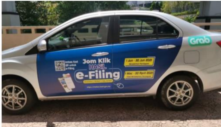
Pendapatan sebagai pemandu GrabCar juga boleh dikenakan cukai pendapatan sekiranya memenuhi syarat.

Sementara itu, yang ketiga adalah syarikat membina medium antara pekerja bebas dengan pelanggan menggunakan platform aplikasi teknologi seperti Grabfood, Foodpanda, TaskRabbit, Bungkusit serta perkhidmatan seru-pandu seperti Grab dan MyCar.