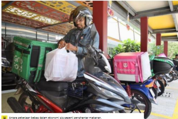
Antara pekerjaan bebas dalam ekonomi gig seperti penghantar makanan.

DENGAN norma baharu akibat pandemik Covid-19, semakin ramai yang beralih kepada pekerjaan lebih fleksibel.