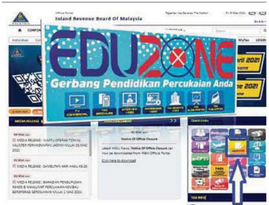
Pembayar cukai boleh mendapatkan maklumat terkini berkaitan Program Jom Klik HASIL menerusi pautan pantas eduZONE di www.hasil.gov.my

Mengulas mengenai perkhidmatan ezHASIL, LHDNM berkata, ia akan memberi kemudahan kepada pembayar cukai menguruskan percukaian secara dalam talian.