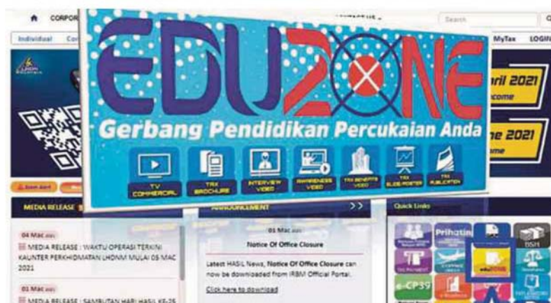
Laman web disediakan LHDNM membantu peniaga e-dagang melaporkan pendapatan bagi tujuan cukai.

Pembayar cukai juga perlu memahami bahawa sebagai rakyat Malaysia, kita harus sama-sama berusaha untuk memajukan negara demi generasi akan datang.