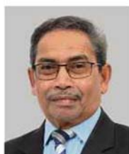
Pensyarah Fakulti Ekonomi dan Muamalat Universiti Sains Islam Malaysia (USIM)